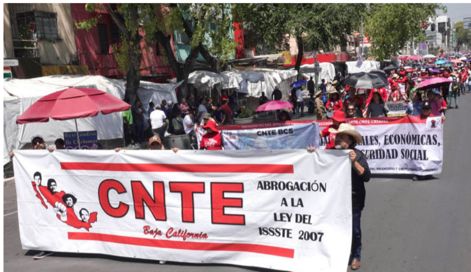
La CNTE anunció que el día 1 de junio iniciará la huelga nacional, con marcha hasta el Zócalo y plantón indefinido

González sostuvo que el movimiento iniciará formalmente el 1 de junio con una