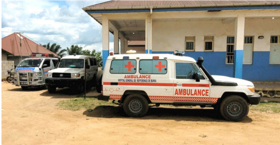
Además de la RDC, ya se identificó un caso de ébola en Uganda

En total, alrededor de veinte víctimas se presentaron, incluyendo una docena que eran desconocidas para la fiscalía.