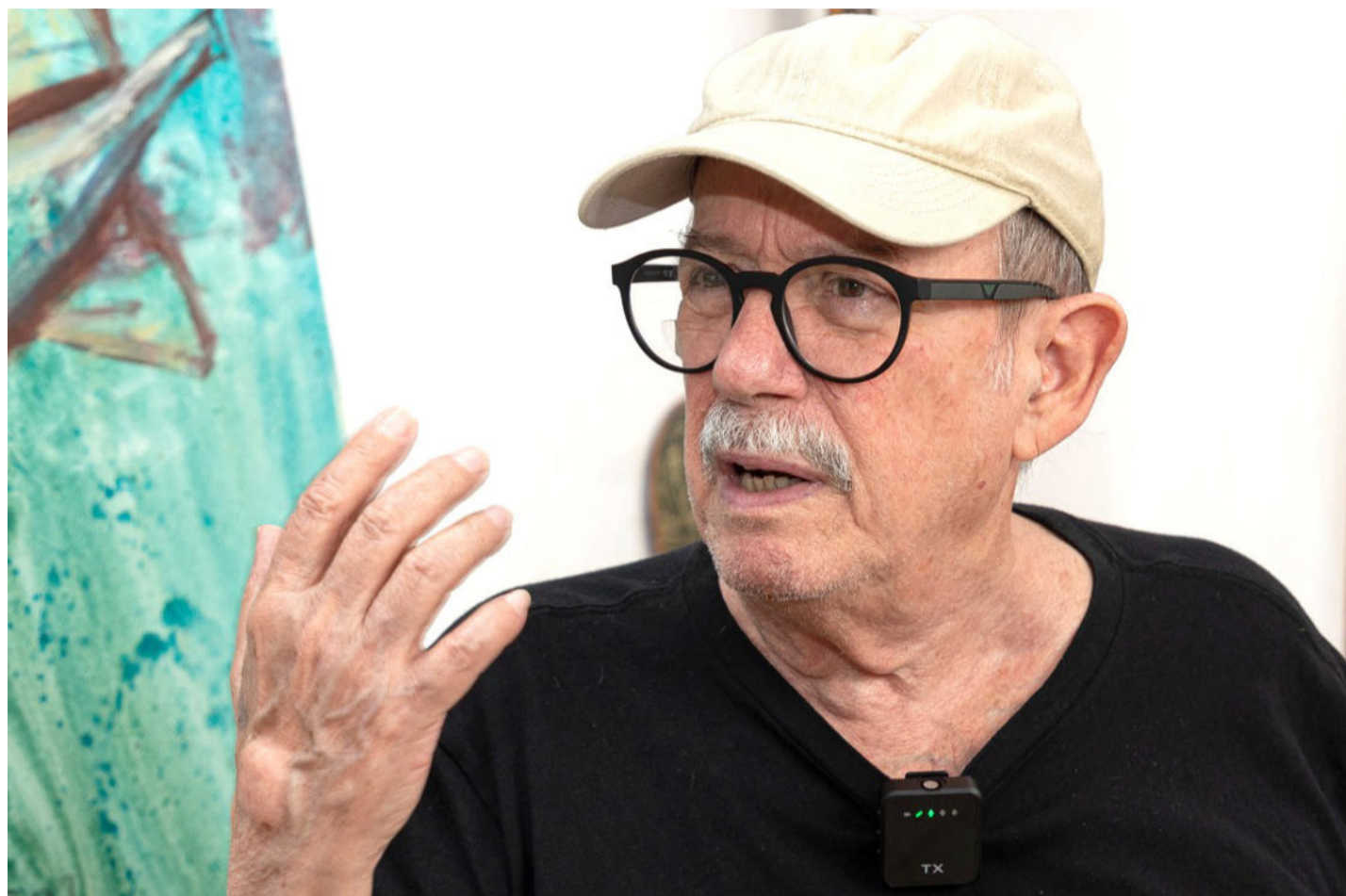
Silvio Rodríguez