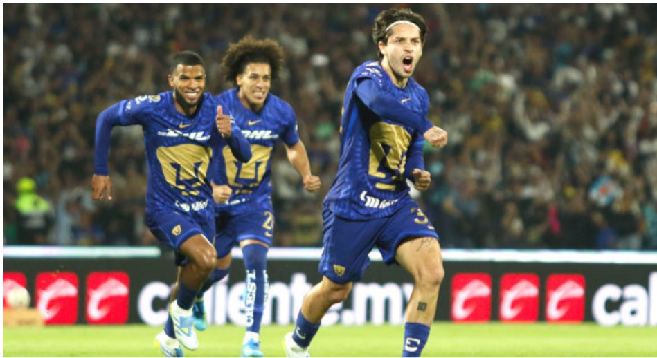
Ciudad de México.- Bastó un gol épico para que Pumas obtuviera el ansiado pase

Mayo 17, Ciudad de México (El Universal).- Cuando se dio cuenta que el disparo de Jordan Carrillo se incrustó en la portería hidalguense, gritó, corrió, brincó, alzó el puño, se abrazó efusivamente con su cuerpo técnico y se limpió el sudor de la frente, pero –sobre todo– se desahogó.