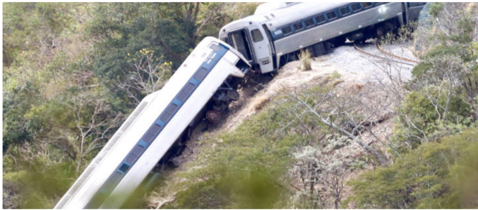
El accidente en diciembre del año 2025 en la Línea Z del tramo Coatzacoalcos-Salina Cruz, dejó 14 muertos y más de 100 heridos

de que un accidente involucre a más de cinco pasajeros, la aseguradora estará obligada a desplegar de manera inmediata un número adicional de ajustadores, suficiente para garantizar la atención simultánea, oportuna y adecuada de cada persona afectada.