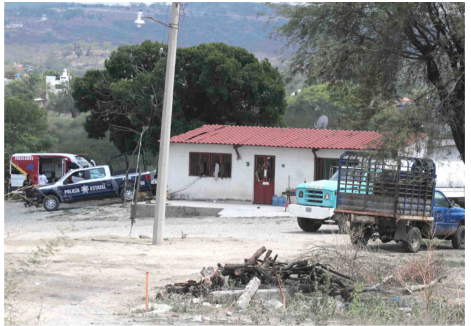
Puebla, Puebla.- Hasta la noche de este domingo no se había dado a conocer la identidad de las víctimas; extraoficialmente se dijo que el dueño del rancho está entre los asesinados

La FGE agregó que se inició una carpeta de investigación.