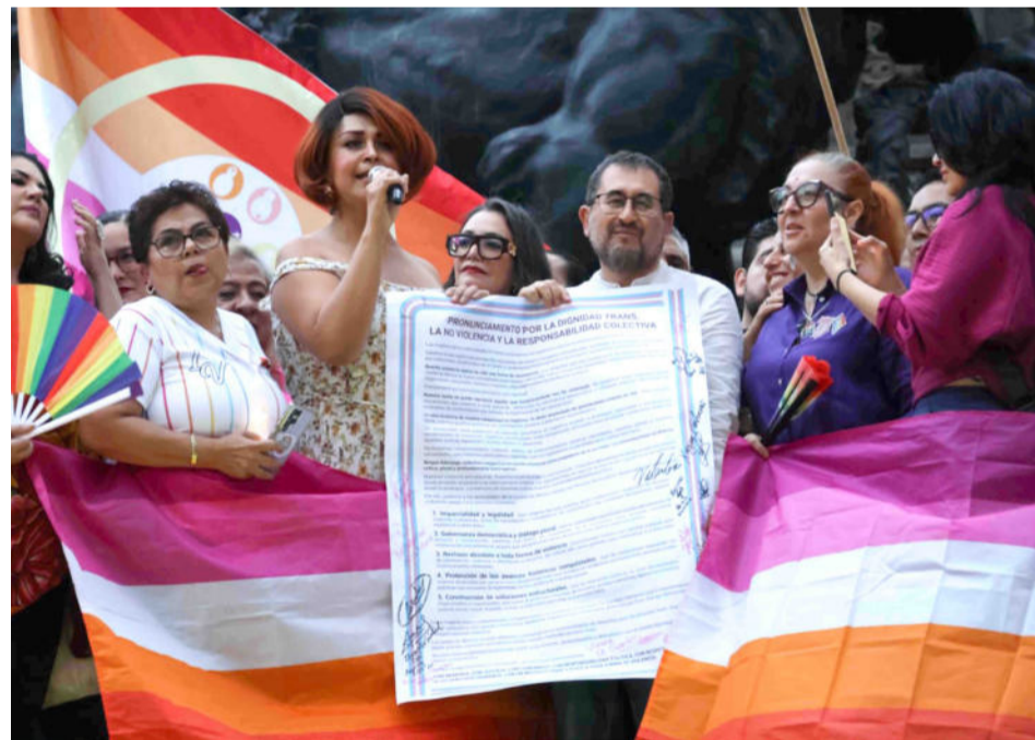
Ciudad de México.- Con motivo del Día Internacional contra la Homofobia, la Transfobia y la Biofobia, se realizó el encendido de luces del Ángel de la Independencia donde se congregaron funcionarios capitalinos, colectivos e invitados