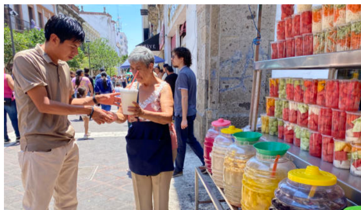
Los vendedores de las aguas frescas, aseguran seguir normas de calidad e higiene para su preparación y venta

Y es que, en diversos puntos del corazón de esta ciudad capital, se han aparecido más y más puestos de vendedores de aguas frescas, algo que no solo es visto con buenos ojos por la ciudadanía, para mu-