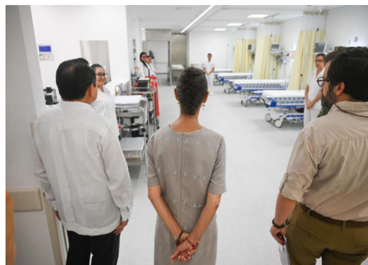
“Aquí no mandan intereses extranjeros ni grupos de poder económico. México es una nación libre, independiente y soberana

5 mil mdp, tiene una capacidad para realizar mil 400 cirugías mensuales y más de mil consultas diarias; cuenta con 43 especialidades, más de 650 camas y 16 quirófanos. Además de que permitirá regularizar a 2 mil 500 trabajadores y trabajadoras de la salud, crear 3 mil nuevas plazas e incorporar a mil 500 especialistas.