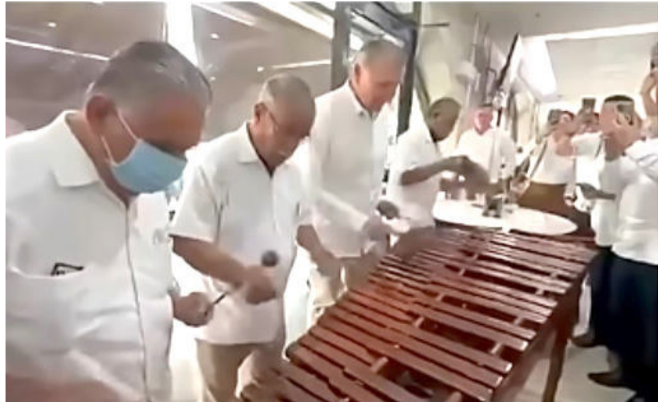
Al exgobernador de Tabasco se le vio contento y relajado, e incluso desinhibido

En un comunicado, señaló que encuestas y otros ejercicios publicados recientemente, así como mediciones internas, muestran que el PAN pasó de 7% a 21% en las preferencias electorales en apenas un año, lo que significa que ha triplicado su crecimiento y