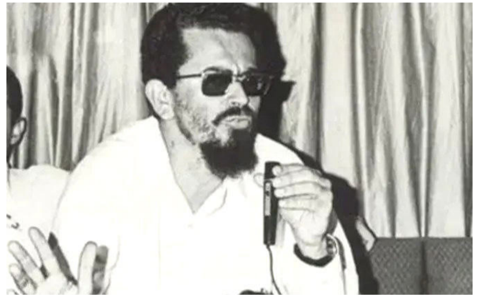
A Carlos Fonseca Amador