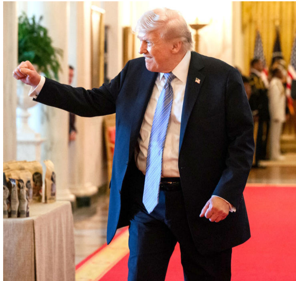
Donald Trump

Por una suma de causas (voraz hiperconsumo desmedido, dormirse en los laureles,