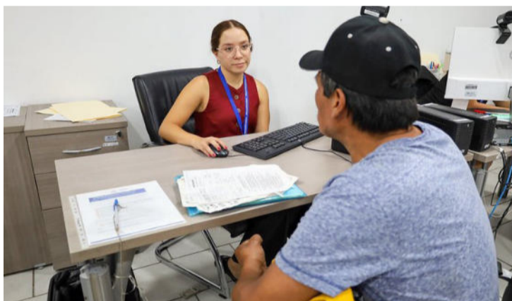
Los trabajadores que no reciban utilidades pueden acercarse para recibir asesoría a la Procuraduría General de la Defensa del Trabajo o al Centro de Conciliación Laboral Jalisco

ma, o quienes hayan estado en el periodo de incapacidad temporal, por maternidad y paternidad”.