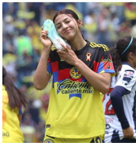
Ciudad de México.- América logró su tercer título femenino

Al inicio de la segunda parte, Manrique volvió a fallar y la estrella del ataque ame-