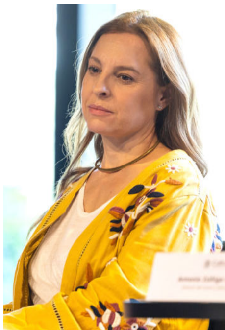
Marina de Tavira

“La maternidad es infinita. Pero aquí hablamos de una mujer que ve crecer a sus hijas y comienza a preguntarse dónde estaba cuando empezó a ser madre y dónde está ahora, en un momento en el que aparentemente le toca aprender a soltar, aunque sabemos que nunca se suelta del todo”.