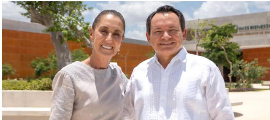
Mérida, Yucatán.- El gobernador Joaquín Díaz Mena firmó con la presidenta el Convenio de Federalización IMSS-Bienestar

“Nadie le va a arrebatar la transformación al pueblo de México, le pertenece al pueblo. Ningún gobierno extranjero le va a arrebatar la transformación al pueblo de México”.